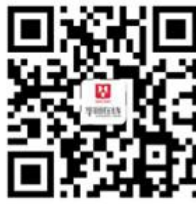
华图在线事考培训微博